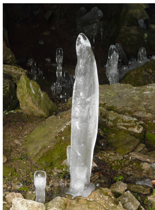
scultura di ghiaccio

Lasciate le macchine al bivio dopo Colloro che indica a sinistra Capraga e a destra la Cappelletta di Lut, noi seguiamo quest'ultimo e a piedi percorriamo per un breve tratto la strada consortile chiusa al traffico, fino a incontrare il sentiero in salita sulla sinistra che ci porta a Lut. Da qui una lunga diagonale ci porta nei pressi dell'Alpe La Piana, in breve si sale alle baite sparse tra i prati dell'Alpe La Motta e dopo una breve discesa si attraversa dapprima il Rio Motto e poco dopo il Rio Crot per poi iniziare la salita che non ci lascerà fino a quando non raggiungeremo l'Alpe La Colma, dove vi è un bivacco sistemato dal Parco Nazionale della Val Grande nel 1999. Da qui, seguendo la mulattiera militare, si sale alla vetta del Proman da cui si gode una vista panoramica a 360° particolarmente emozionante.