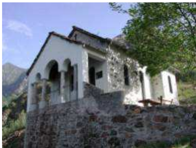
Chiesetta di Lut

Partendo da Premosello Chiovenda si tiene la destra del torrente che attraversa il paese. All'altezza del ponte che porta a Colloro si svolta a destra e su strada inizialmente asfaltata, poi sterrata, si giunge all'Alpe Mota Rossa e in breve a Pian del Manico. Da qui il sentiero inizia a salire nel bosco e mantenendosi sul lato sinistro del vallone del Rio Teu, si arriva all'Alpetto Cornala bellissimo pianoro ove in primavera si può ammirare una stupenda fioritura di azalee. Dopo breve salita ecco l'Oratorio di Lut (eretto nel 1620), da qui in discesa si raggiunge Colloro, piccolo abitato disteso su una balconata naturale protesa verso la valle. Dopo la sosta per il pranzo presso il circolo si rientra per mulattiera a Premosello.